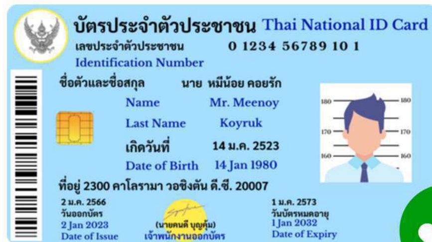
Thai National ID Card / Driving license

must be original, and undamaged with all information clearly legible and visible. and must still valid, not expired