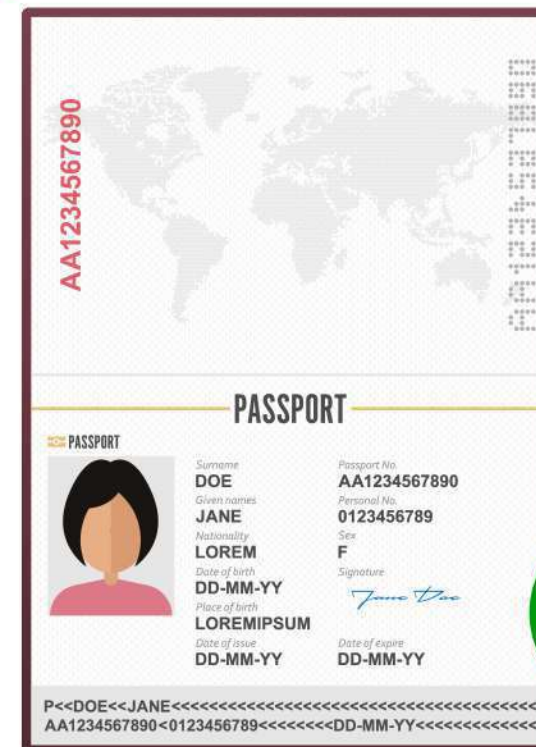
For foreigners, a passport